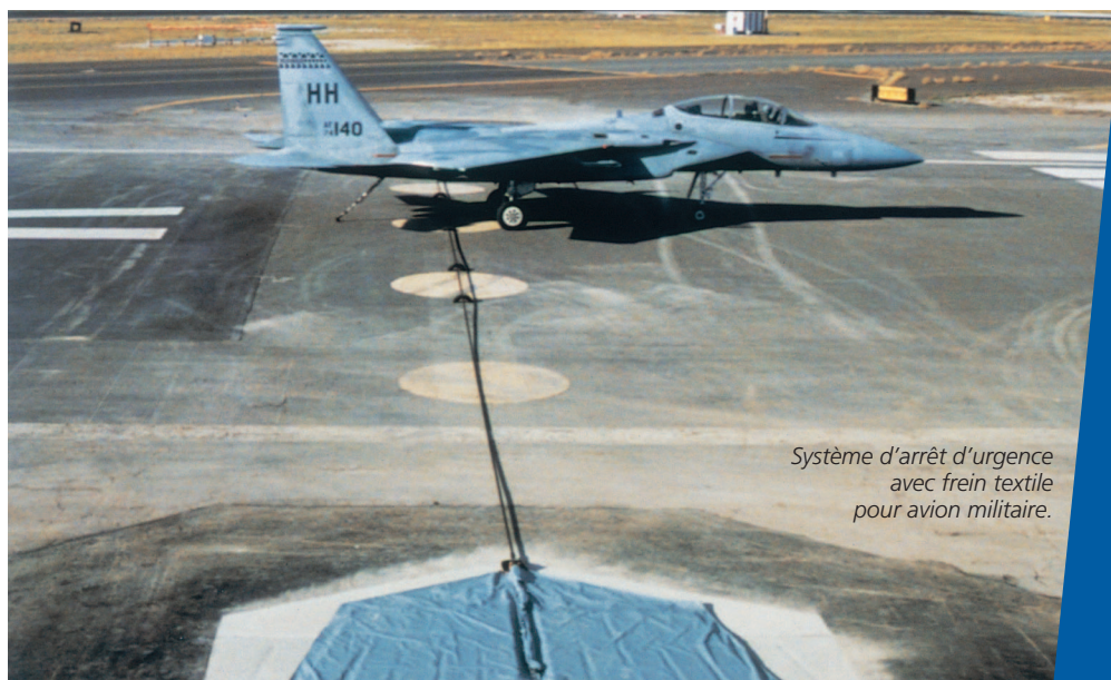
Systeme d'arrêt d'urgence avec frein textile pour avion militaire.

Dans son édition d'octobre 2006, le magazine Private Equity International a nommé Duncan Weston, Associé en charge de l'Europe centrale de CMS Cameron McKenna, parmi les trente avocats les plus influents en matière de private equity .