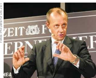
Riet seiner Partei zu einem wertkonservativeren Profil und Unternehmen zu mehr politischer Teilhabe: CDU-Politiker Friedrich Merz