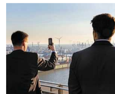
Würdiger Rahmen und großes Interesse: mehr als 100 Unternehmerinnen und Unternehmer zu Gast im Penthouse Elb-Panorama